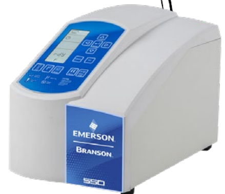
Modelo mostrado: SFX550

La bocina de caudal continuo es compatible con SFX250 y SFX550.