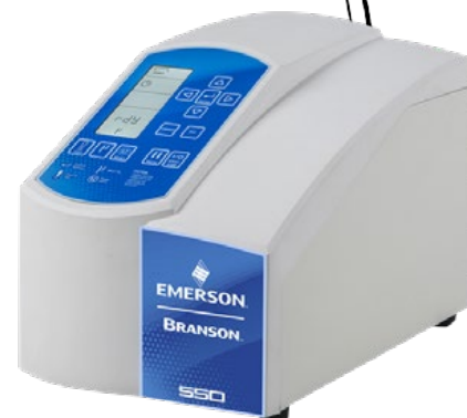
Modèle SFX550 présenté

Sonotrode d'écoulement compatible avec les modèles SFX250 et SFX550.